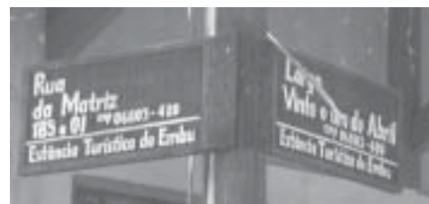
Um bom exemplo de placa no Centro Histórico.

para sinalização de cidade, parece coisa de auto-estrada, de tão grande", destaca ele. E destoa completamente de outras ações bem-intencionadas, como a reconstrução do piso de paralelepípedos nas ruas do Centro e a inserção de placas entalhadas nomeando as ruas. Pois, com eles, é uma no cravo, e duas na ferradura.