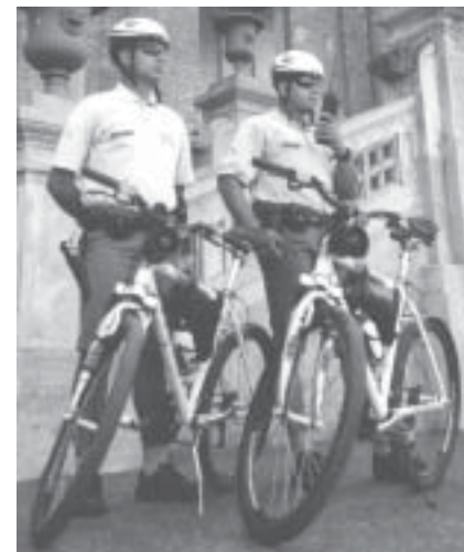
Polícia Militar e ACISE: a questão principal é o compromisso.

A ACISE está consciente de seu papel de agente estimulador de ações, parceiro do Poder Público e de suas instituições. Foi com este espírito que nossa entidade atendeu prontamente às solicitações da Polícia Militar, mobilizou seus associados e conseguiu a doação de seis bicicletas para a implantação do policiamento ciclístico. Infelizmente, quase um ano se passou e a definitiva implantação não ocorreu. Pior: dois policiais ciclistas fizeram - durante UM ÚNICO DIA - o policiamento, na esperança de dissimular o atraso no compromisso firmado com o empresariado embuense, especialmente os do Centro Histórico. Não colou.