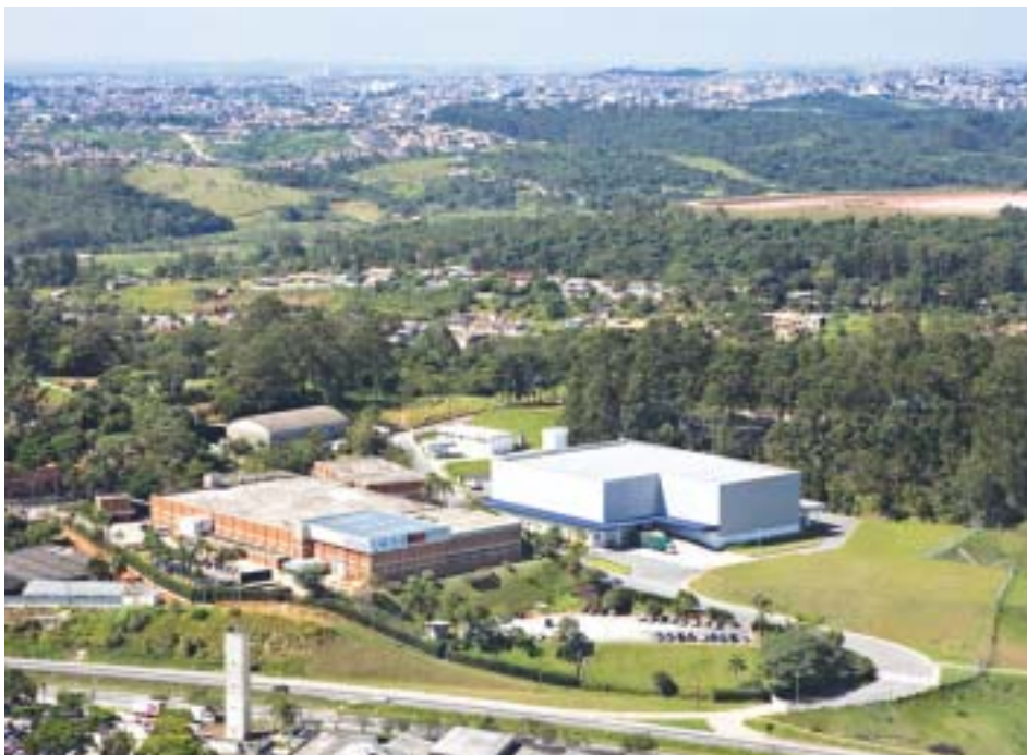
Vista aérea da Védát, em Embu: a construção de um novo prédio para ampliar a produção é uma certeza, neste ano de comemorações da empresa.