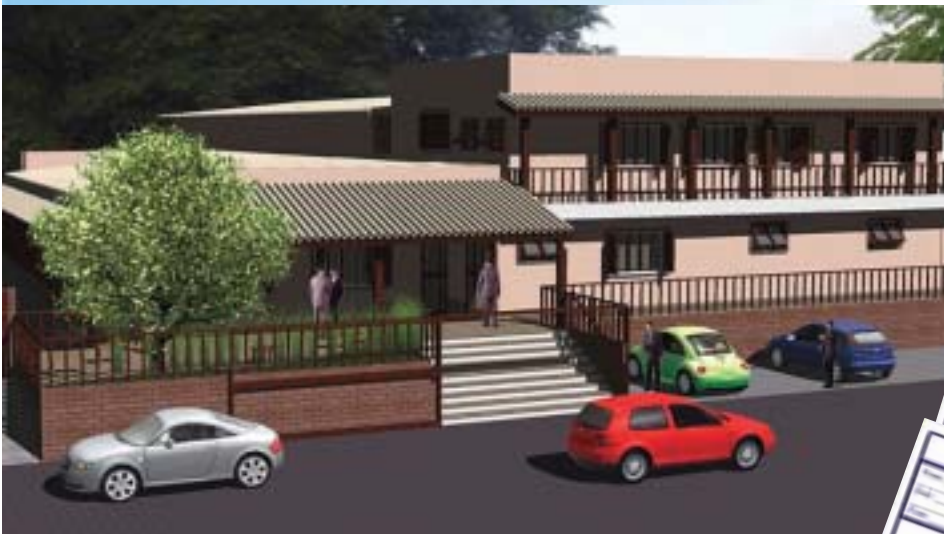
Este é o projeto da reforma da sede da ACISE: reforma garantirá mais espaço para eventos e facilidade no acesso, bem como possibilitará uma dinâmica maior no trabalho de defesa dos associados. Rifas no valor de R$ 1,00 deve tornar este sonho realidade, e ainda dão direito ao contribuinte de concorrer a um Celta zero km 2008.

Várias ações da ACISE estão mexendo com o final-de-ano de empresários, associados e diretores da entidade, sendo que uma das mais importantes é a da “Ação Entre Amigos”, que visa arrecadar fundos para a obra de reforma da nossa sede, situada no Centro da Cidade. Com apenas um real, qualquer pessoa - cidadão embuense ou não, associado ou não à ACISE pode ajudar. Participe desta corrente. Informe-se: 4781-1044.