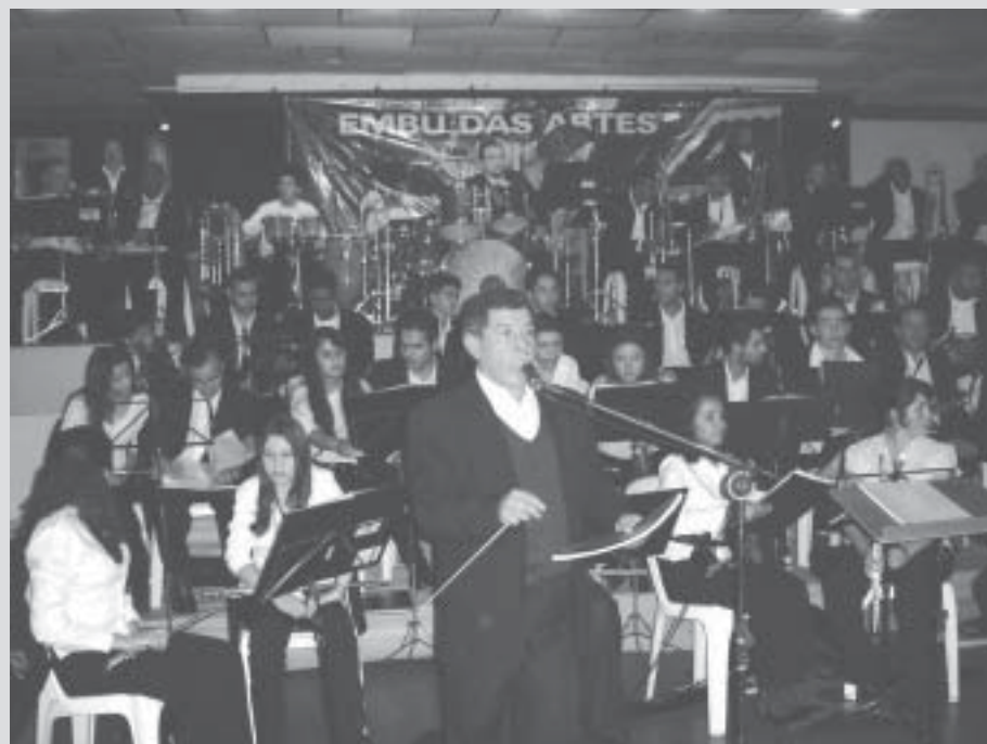
Banda Municipal de Embu, a principal atração da noite: promessa de repertório eclético e dançante para entreter associados e convidados na festa de final-de-ano da entidade.

Evento acontecerá na sexta, dia 7 de dezembro, no Restaurante Recanto Gaúcho