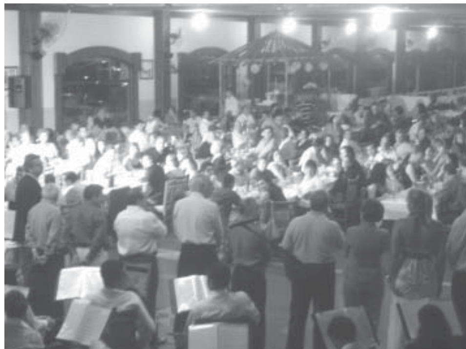
Imagem da festa de 2006, quando associados, convidados, políticos e personalidades de Embu e região lotaram as dependências do Recanto Gaúcho para mais um jantar de confraternização.

Evento acontecerá na sexta, dia 7 de dezembro, no Restaurante Recanto Gaúcho