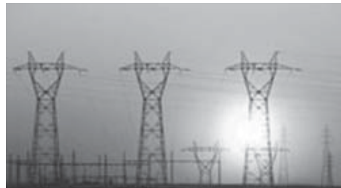
Por conta de contribuições "escondidas", brasileiro paga 43,7% de tributos na conta. A boa notícia é que a Aneel começa a revisar para baixo o valor do serviço.

O Brasil é campeão mundial em uma categoria nada honrosa: cobrança de impostos e encargos na conta de luz. O consumidor pode não saber para onde vai o dinheiro, mas sente no bolso: do valor total da conta, 43,7% são encargos, tributos e impostos, afirma o Instituto Acende Brasil, com base em dados da consultoria Price/Waterhouse Coopers.