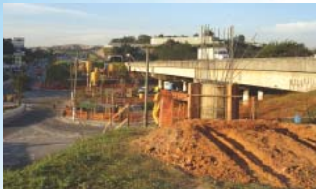
Acima, foto das obras na lateral do viaduto da entrada principal de Embu das Artes. Do centro para a direita, a construção de um alicerce confirma informação de que a BR-116 será movida.

Mais cedo que que nós imaginávamos, as obras do trecho sul do Rodoanel começaram. Contrariando a lógica da construção do trecho oeste (em que a obra seguia claramente um progresso linear ), hoje o trecho sul foi dividido em cinco lotes, com as empreiteiras iniciando as obras em mais de dez pontos, ao longo do traçado, desde Mauá até Embu das Artes. Só em nossa cidade, os trabalhos já estão adiantados em três pontos: na BR-116 (foto), no bairro Chácara Santa Bárbara e na divisa com Itapeverica.