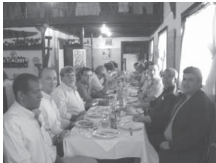
Mesa principal, com associados e convidados no almoço acisence do Restaurante Pé da Serra.

Almoço Acisence aconteceu dia 15/06 no Restaurante do Jd. Pinheirinho