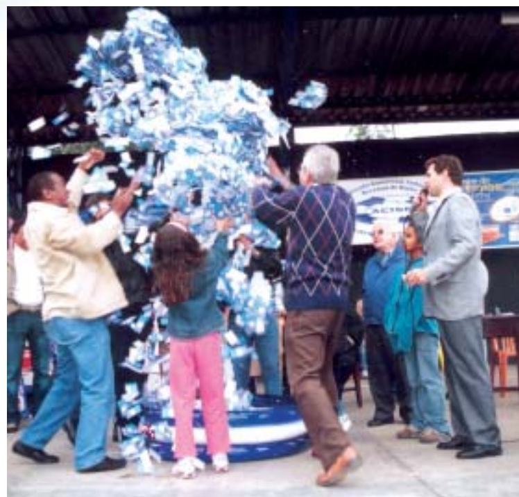
Na foto, momento do sorteio do carro no Show de Prêmios em 2005, durante evento público na Praça da Lagoa. Nova edição deverá seguir o mesmo padrão, sorteando também um carro e estimulando a compra no comércio da cidade.

Para quem quiser saber mais sobre como participar do evento, é só entrar em contato pelo telefone 4781-1044, ou aguardar para maiores divulgações das regras do evento.