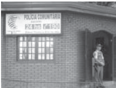
Policamento no Centro: somente a base comunitária e a Delegacia da Mulher

Uma das grandes preocupações em todo final de ano diz respeito ao aspecto segurança: com o aumento do movimento no comércio e nos bancos (a grande maioria sediada na região do Centro Histórico) a preocupação é pertinente, pois permanece uma sensação de insegurança e afastamento da presença policial do Centro, principalmente depois da mudança da 3ª Cia. para o Jd. Pinheirinho.